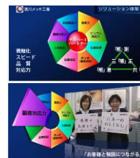
*画像はホームページから