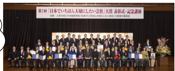
第7回受賞者記念写真