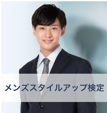
メンズスタイルアップ検定

りそな総合研究所㈱「りそなーれ」編集室 東京：03-5653-3808 大阪：06-6258-8805