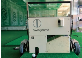
連続打ちマシン「スイングノーム」