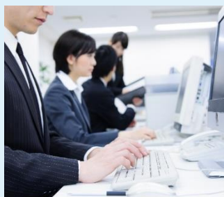
PC (Word・Excel) スキル向上