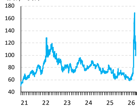
【図表1】 原油価格の推移(ドバイ) (ドル/バレル)

足元の中東情勢については、4月上旬の米国とイランによる2週間の停戦合意で、ホルムズ海峡の通航が再開する期待が高まったが、その数日後には両国の主張の食い違いから、再び海峡が封鎖された。足元の原油相場（ドバイ）は、1バレル100ドル前後で高止まりしている（図表1）。